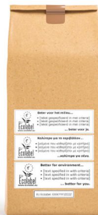
Exemplo de logótipo opcional no produto.