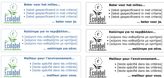
Exemplo de logótipo opcional.

Criar diferentes caixas para cada língua da UE traduzida.