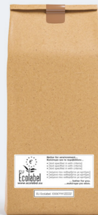
Exemplo de logótipo opcional no produto.