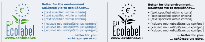
Exemplo de logótipo opcional.

Incluir todas as traduções pretendidas dos pontos informativos para as línguas da UE numa única caixa com a tradução de «Melhor para o ambiente..., ... melhor para si» em todas as línguas da UE correspondentes.