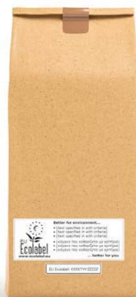
Exemplo de logótipo opcional no produto.